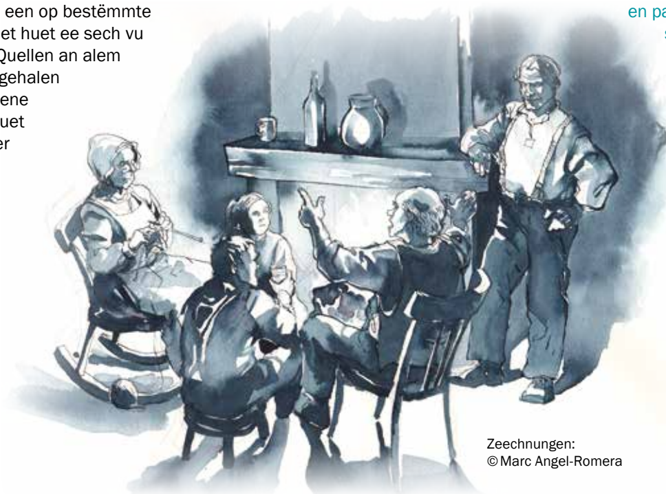
Zeechnungen: © Marc Angel-Romera

En effet, le chevalier sans tête errant dans les bois du Marienthal, le feu follet dansant sur les berges de l'Eisch, les lutins des Mamerleeën et autres créatures fantastiques – tout ce monde faisait non seulement partie d'une mythologie ancienne, vestiges de croyances païennes datant de la nuit des temps, mais menait une existence bien réelle dans la vie de nos ancêtres. On évitait de traverser le bois les nuits de lune pleine, on faisait le signe de croix en passant certains endroits, on se tenait à l'écart des sources maudites et des ruines hantées – et, malgré ces précautions, on continuait d'avoir peur.