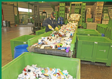
Sortierung - Tri

Beipackzettel und Verpackungen werden recycelt.