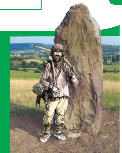
«Recki» et son menhir