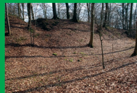
Emplacement des remparts de la Wichtelslee