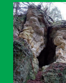
Wichtelcherslee, entrée de grotte