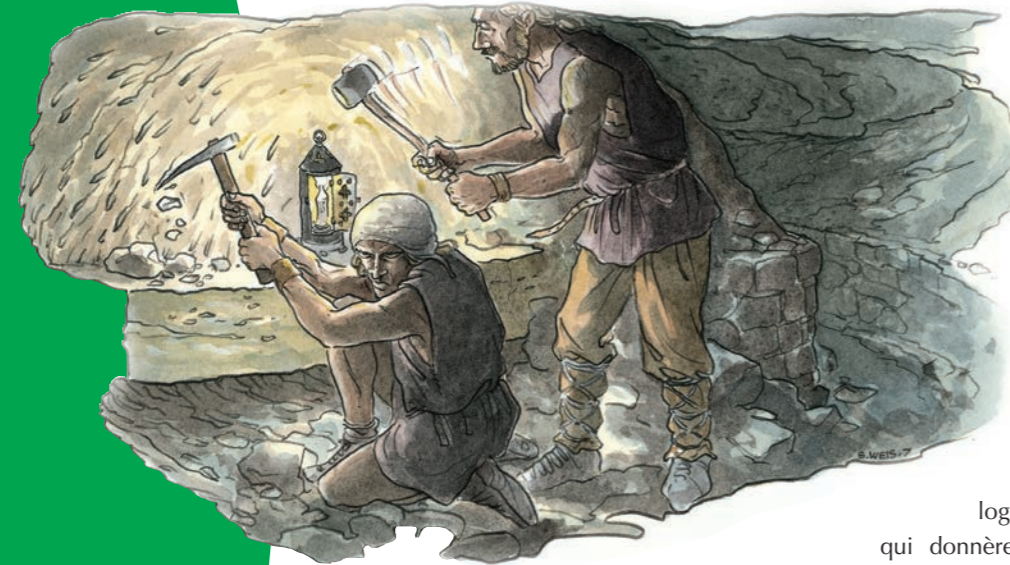
Exploitation souterraine dans les «Mamerleeën»

Dans les années 60 et 70 du dernier siècle, des spéléologues ont étudié les grottes et leur ont donné un nom. Afin de protéger les chauves-souris hibernant dans ces grottes, plusieurs entrées sont fermées par une grille spéciale du 15 novembre au 15 avril. De Claushaff, il est très facile d'y accéder à pied.