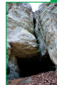
Mamerlach, entrée de grotte

La «Wichtelcherslee», en face du Hunnebour, présente également des entailles dans lesquelles des poutres étaient encastrées autrefois. Les entailles à deux mètres du sol laissent même supposer la présence d'un étage. Les parois du rocher ont été taillées afin d'agrandir la grotte et de la rendre plus habitable.