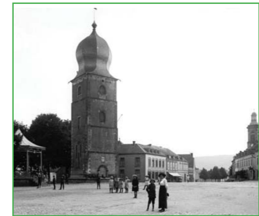
De Michelsturm rond 1900

Commune de Mersch Château de Mersch Tel.: 32 50 23 - 1