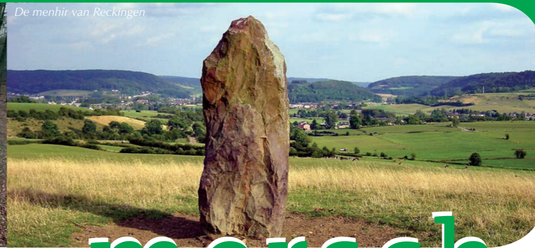
De menhir van Reckingen