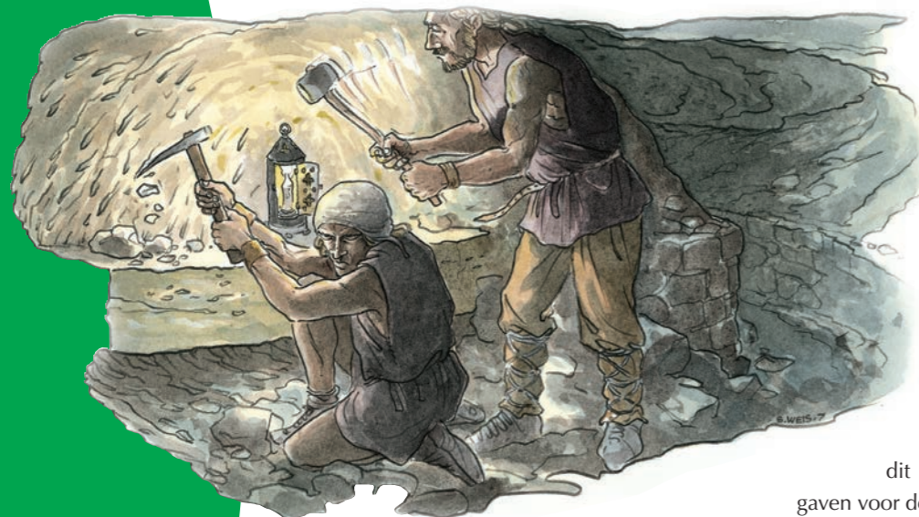
Ondergrondse ontginning in de „Mamerleeën“