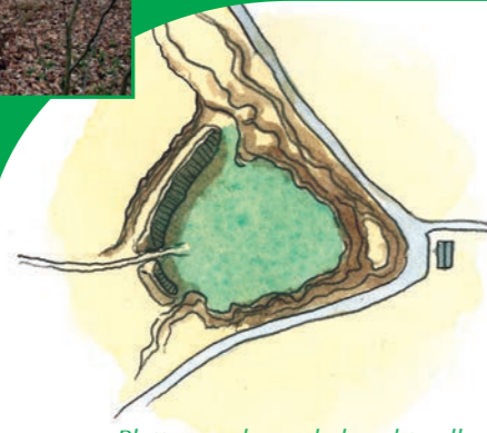
Plattegrond van de burchtwallen