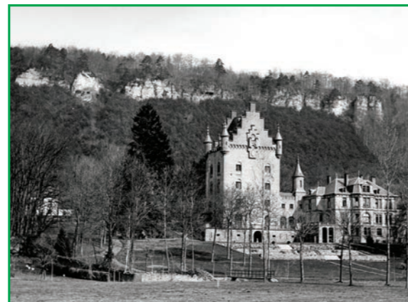
Het kasteel Schönfels hangt over de „Mamerleeën“ (rond 1930)