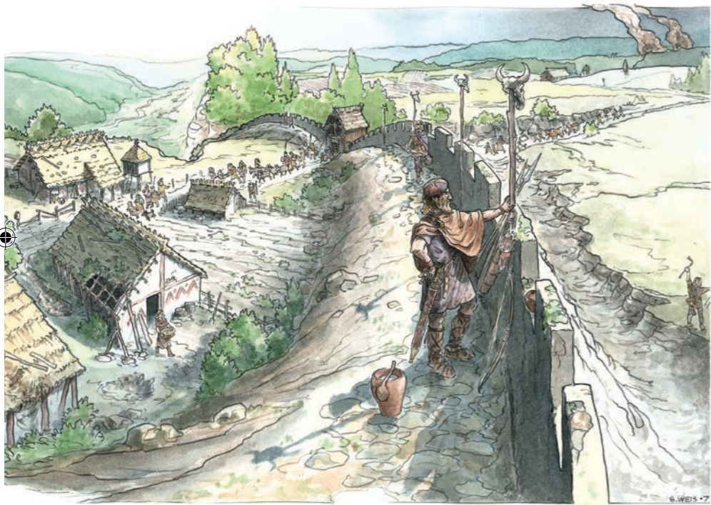
Veilig in de vluchtburcht